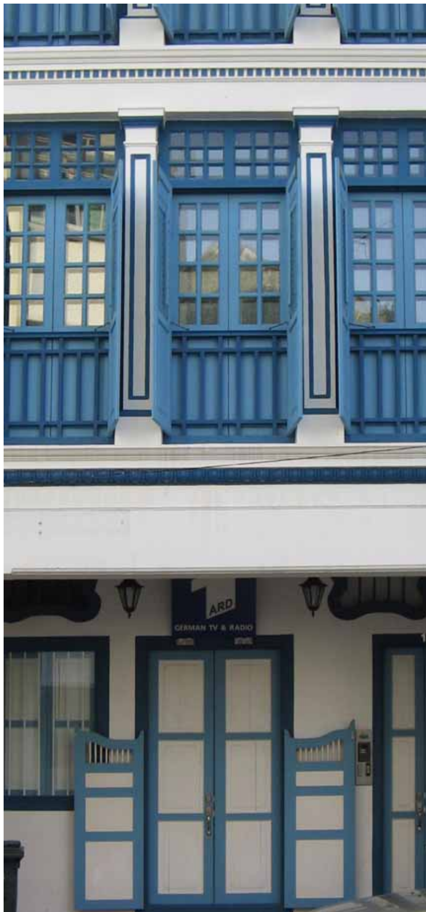
Une rencontre surprenante en plein Chinatown : le superbe bureau de nos collègues de l'ARD