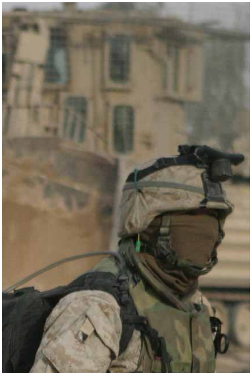
Patrouille des Marines à Fallujah, Irak

elle-même et les faits qui l'ont précédée avaient déjà été divulgués et parfois déformés ; on avait désigné les fautifs et on croyait savoir qui avait tort et qui avait raison. Mais ces difficultés ont également permis de faire évoluer la situation. Le rapport Neil et les propositions qu'il contient sont l'un des aspects positifs de toute cette affaire.