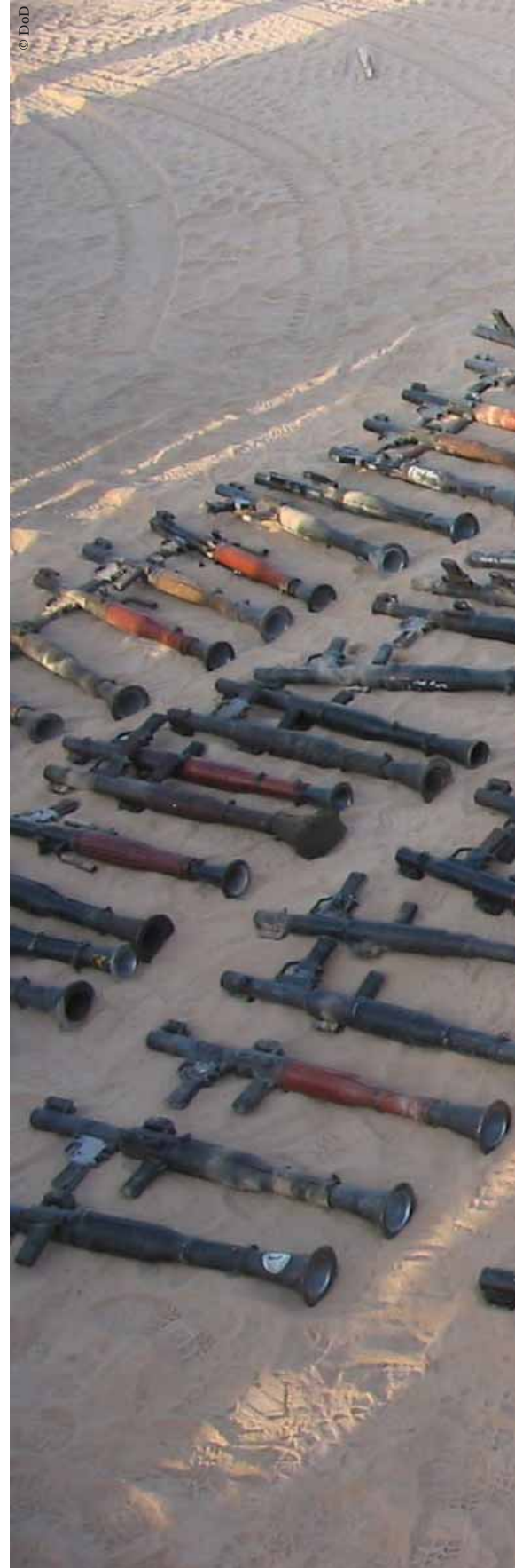
Armes récupérées pas les forces américaines à Najaf, Irak

Le rapport évoque également les problèmes posés par les séances de questions/réponses. La rédaction de ce chapitre du rapport a été motivée par l'émission de Andrew Gilligan diffusée par la BBC, sur les armes de destruction massive. Le rapport Neil est très clair : lorsque la BBC rend