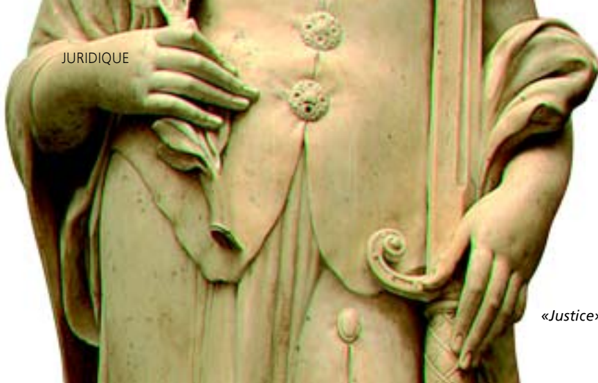
«Justice», Barthélémy Prieur, 1610