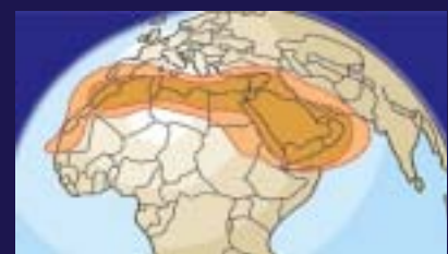
et bande Ku