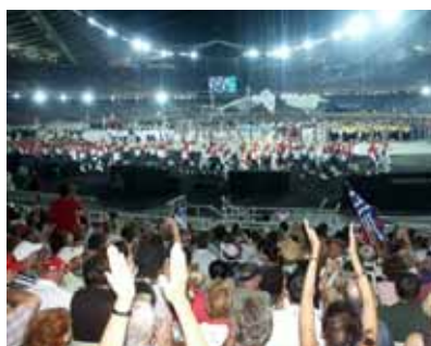
La délégation suisse

Des générations d'hommes se succèdent Comme changent les feuilles des arbres. Homère