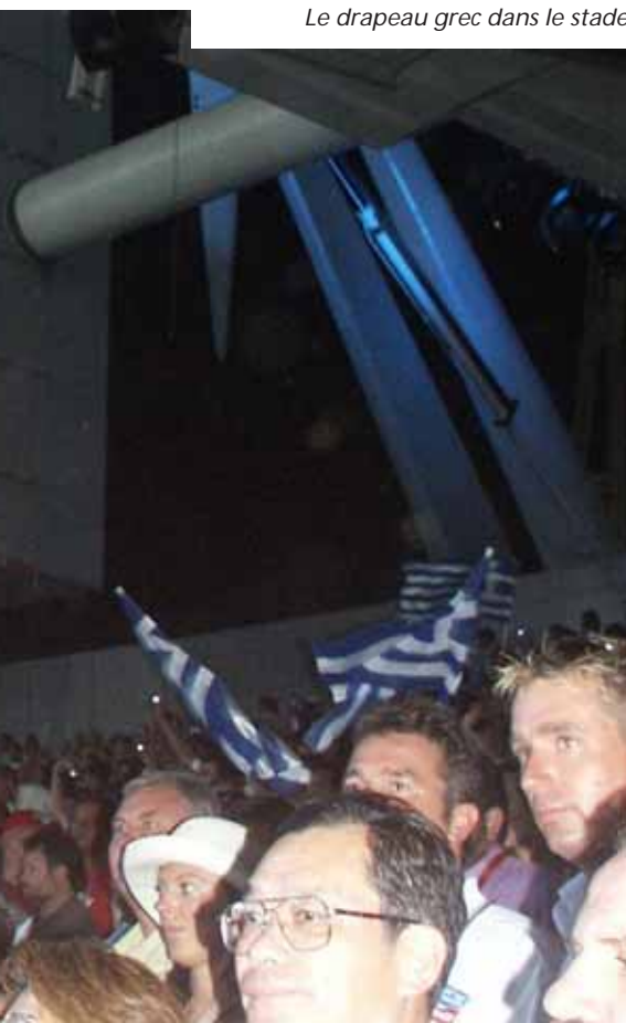
Le drapeau grec dans le stade