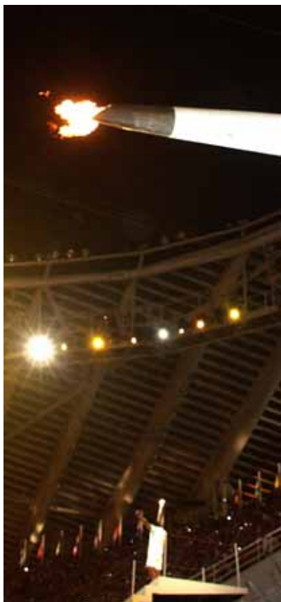
La flamme est allumée