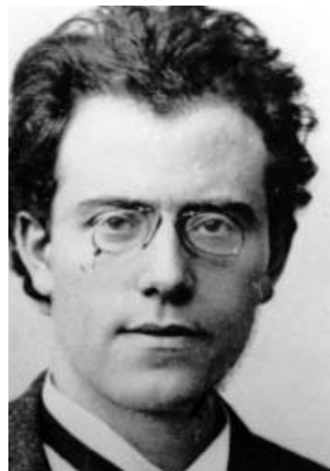
Gustav Mahler im Jahr 1892; zu dieser Zeit war er Erster Kapellmeister am Hamburger Stadttheater

Die ersten „Wunderhorn“-Lieder entstanden in den Jahren 1892/93, in denen sich Mahler mit der Instrumentierung seiner „Lieder eines fahrenden Gesellen“ nachhaltig der Orchesterliedgattung