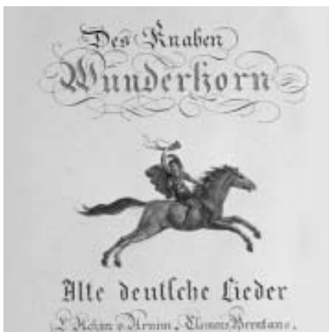
Des Knaben Wunderhorn; Titelblatt der Erstausgabe von 1806

Eine dritte und letzte Gruppe zeichnet sich mit jenen Liedvertonungen ab, die einen kritischen Protest formulieren. Ihre herausragende Bedeutung lässt sich schon dadurch ermessen, dass sie alle in unmittelbarer Beziehung zu Mahlers Sinfonik stehen: „Das irdische Leben“ (ursprünglich als 2. Satz der Vierten Sinfonie vorgesehen), „Des Antonius von Padua Fischpredigt“ (Vorlage für